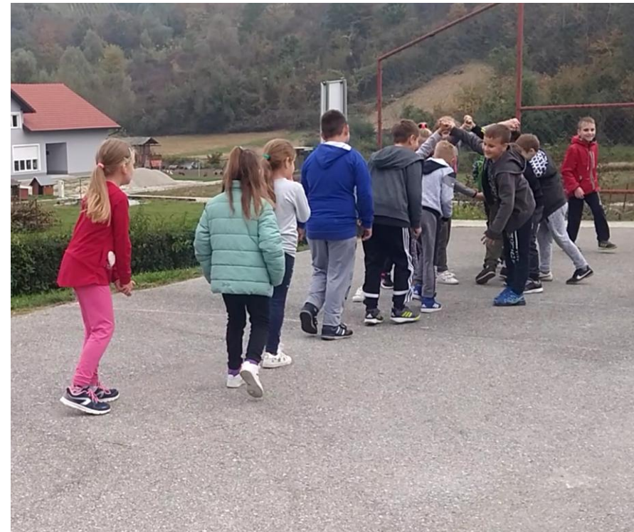
Igra „Stare košare”