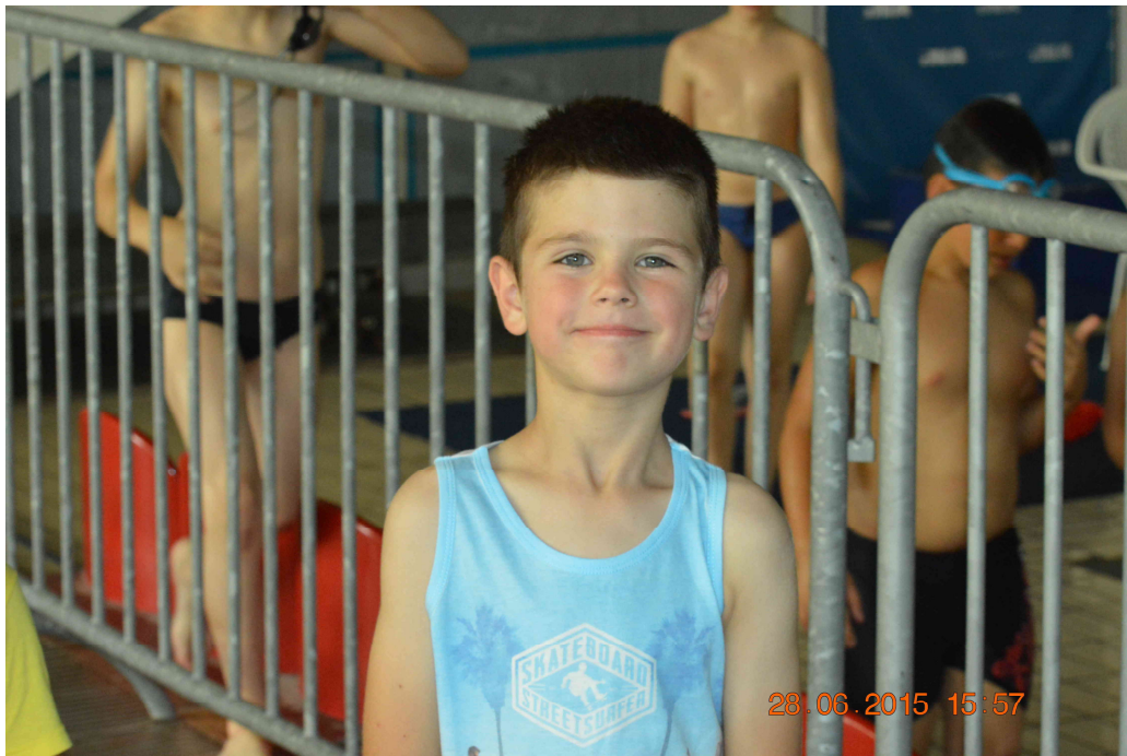
Uz roditelje i brat kao najvatreniji navijač.