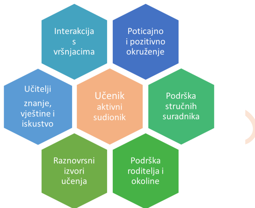
Slika 2. Ključne odrednice odgojno-obrazovnog procesa

Učenik je u središtu odgojno-obrazovnog procesa, a učenje se odvija u interakciji s učiteljem, ostalim učenicima, partnerima u odgojno-obrazovnome procesu (roditeljima, stručnjacima, širom zajednicom...), ali i samostalno u radu na odgojno-obrazovnim sadržajima. Uloga je učitelja stvaranje poticajnoga okruženja koje u što većoj mjeri omogućava različite vrste interakcije (slika 2.).